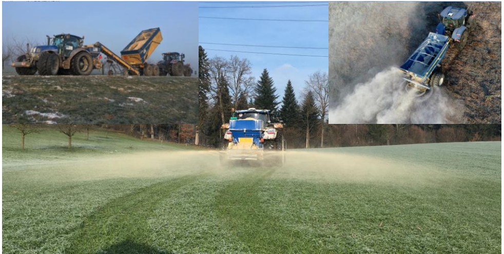
Bodenschonende Ausbringung und überladen am Feldrand

Hinweis: Beide Produkte sind Bio – anerkannt